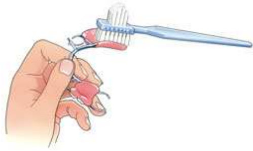
Reinig uw prothese na iedere maaltijd

Vooraf onder uw plaat- of frameprothese kunnen veel etensresten blijven zitten. Reinig uw prothese na iedere maaltijd dan ook goed met een speciale protheseborstel, bijvoorbeeld van Lactona of Oral-B, en water. Gebruik géén tandpasta. Die kan te veel schuren. Reinig ook het slijmvlies onder uw plaat- of frameprothese (uw kaak, gehemelte en de overgang van de kaak naar de wangen) en poets uw eigen gebit zorgvuldig. Gebruik hiervoor een gewone zachte tandenborstel met fluoridetandpasta. Besteed extra aandacht aan het verwijderen van tandplak. Vooral op die tanden en kiezen waarop uw prothese steunt. Uw tandarts of mondhygiënist kan u hierover informeren.