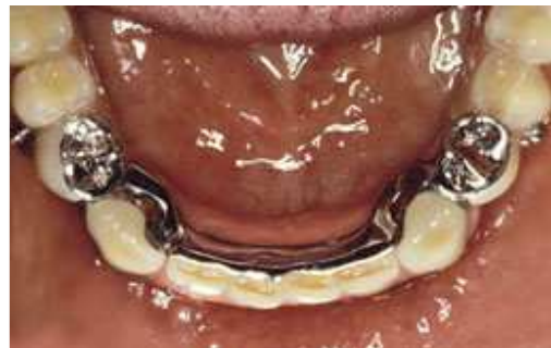
Frameprothese met verankering op kronen