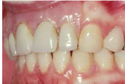
Plaatprothese van opzij