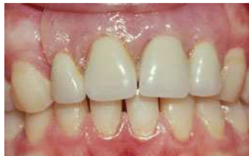
Plaatprothese van voren

De plaatprothese is gemaakt van een roze, tandvleeskleurige kunsthars. Daarin zijn de kunsttanden en kiezen verankerd. De gehele plaatprothese rust op het slijmvlies van de mond. Deze zit eventueel met ankertjes vast aan overgebleven tanden of kiezen.