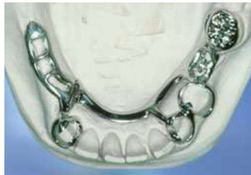
Frameprothese in wording op een gipsmodel, zonder kunsttanden en -kiezen

De frameprothese is gemaakt van metaal. Op het metaal is een tandvleeskleurige kunsthars aangebracht. Daarop zitten de kunsttanden of -kiezen. De frameprothese rust vooral op een deel van de overgebleven tanden of kiezen. Afhankelijk van het ontwerp rust de frameprothese ook meer of minder op het slijmvlies. De tandarts kan de frameprothese op twee manieren bevestigen. Of met metalen ankertjes die om enkele tanden of kiezen klemmen of met een soort slotje. Bij een slotje wordt de ene kant vastgemaakt aan een kroon, tand of kies en de andere kant zit vast aan de frameprothese. De frameprothese kunt u op die manier in het slotje schuiven. Het slotje zit doorgaans aan de binnenkant van de tanden en kiezen en is dus niet vanaf de buitenkant zichtbaar. Ankertjes zijn vaak wel enigszins zichtbaar.