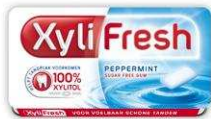
Kies suikervrije kauwgom

Het is niet mogelijk de speekselproductie te stimuleren wanneer uw speekselklieren niet meer werken. Als ze nog maar een beetje functioneren, kunt u ze onvoldoende stimuleren. Dan kunt u met behulp van zogenoemde speekselvervangers de gevolgen van een droge mond beperken. Dit zijn speciale vloeistoffen in de vorm van een bevochtigingsgel (Biotène Oral Balance) of een verstuiver (Glandosane, Xialine). Een bevochtigingsgel brengt u op de slijmvliezen aan. Met behulp van een verstuiver kunt u de mondholte met die vloeistof bevochtigen. Het lichtzure Glandosane is voor iemand met eigen tanden en kiezen niet aan te bevelen voor frequent gebruik. Een gel wordt vooral 's nachts prettig gevonden, een spray is vooral overdag aangenaam. Welk middel u het prettigst vindt, moet u zelf ondervinden. Een mondgel is bij de drogist of apotheek te koop. Een speekselvervanger kan de tandarts voorschrijven en is bij de apotheek verkrijgbaar. Overleg in ieder geval met uw tandarts en begin niet op eigen initiatief aan een middel, ook al is dit bij de drogist of apotheek verkrijgbaar.