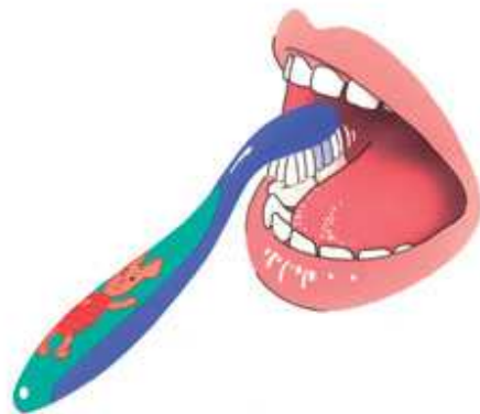
3. Poets hierna bovenop (de kauwvlakken van de kiezen)