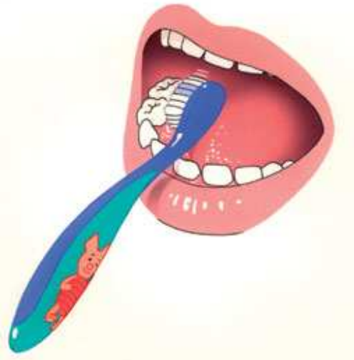
1. Begin beneden met de binnenkant.