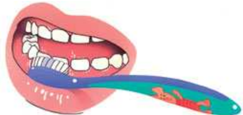
2. Dan de buitenkant