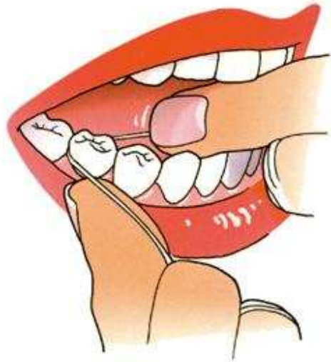
Gebruik voor iedere tussenruimte een nieuw stukje flossdraad