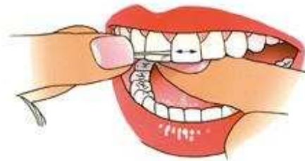
Breng de draad met gedoseerde kracht door het contactpunt

2. Breng met behulp van uw duimen en wijsvingers de draad met gedoseerde kracht en heen-en-weergaande bewegingen door het punt waar de tanden of kiezen elkaar raken (contactpunt). Doe dit voorzichtig en voorkom doorschieten.