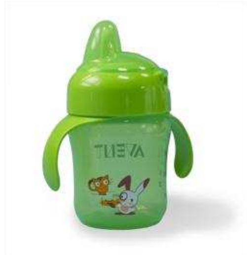
Laat uw kind vanaf 9 maanden uit een beker drinken

Kinderen worden meestal tandeloos geboren. Een kind wisselt zijn melkgebit tussen zijn zesde en twaalfde levensjaar. Zo staat het tenminste in 'de boekjes'. Bij uw kind of cliënt kan de wisselperiode een andere zijn. Kinderen met een verstandelijke beperking hebben vaak een kleine kaak. Hierdoor past het gebit er niet in. Vaak wisselt een kind niet al zijn tanden, maar gedeeltelijk, terwijl de blijvende tanden wel zijn aangelegd. Ook de tijdstippen waarop de tanden en kiezen doorkomen kunnen afwijken.