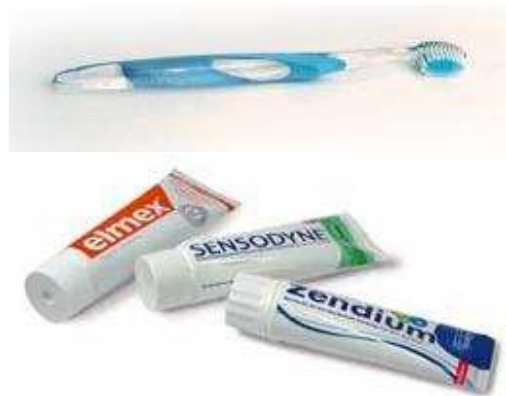
Gebruik een niet-schurende tandpasta