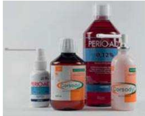
Spoelmiddelen en mondspray met chloorhexidine