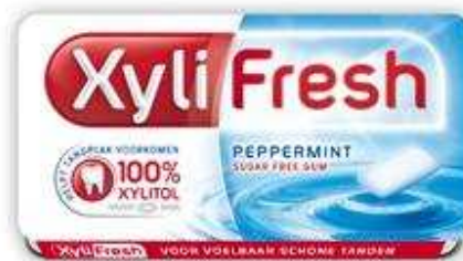
Kies suikervrije kauwgom