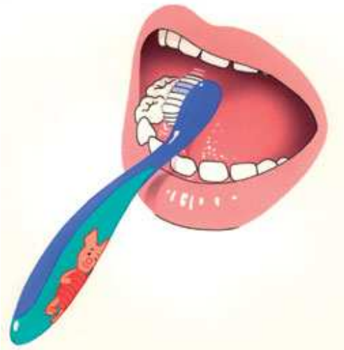
1. Begin beneden met de binnenkant.

Poets volgens de 3 B's: B innenkant, B uitenkant, B ovenop.