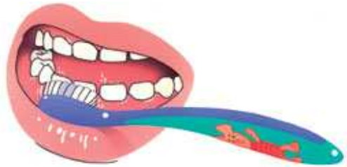
2. Dan de buitenkant