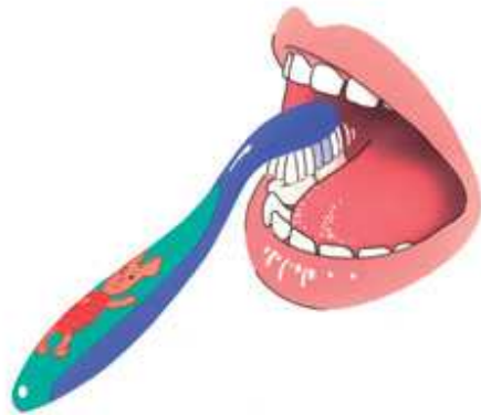
3. Poets hierna bovenop (de kauwvlakken van de kiezen)