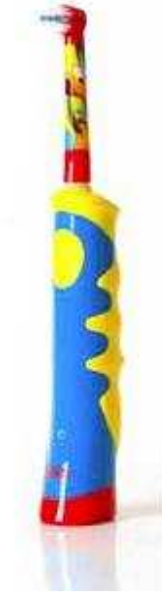
Elektrische tandenborstels voor kinderen hebben een speciale kleine borstelkop

Gebruik een tandenborstel met een kleine borstelkop met zachte haren en bij voorkeur met een lange steel. Zo komt u overal makkelijk bij. Kinderen vanaf drie jaar kunnen ook elektrisch poetsen. Er zijn speciale kinderborsteltjes. Die zijn kleiner en daarom geschikt voor de kindermond. Poetsen met een elektrische tandenborstel is juist leuk voor kinderen. Het draagt bij aan de motivatie om het gebit goed te verzorgen. Kies een tandpasta met fluoride. Fluoride zorgt voor de versterking van het glazuur. Voor kinderen tot en met vier jaar zijn er speciale peutertandpasta's. Hierin zit minder fluoride. Vanaf het vijfde jaar kan uw kind normale fluoridetandpasta voor volwassenen gebruiken. Er zijn ook tubes verkrijgbaar waarop staat 'juniortandpasta'. Kijk dan altijd naar de leeftijd die hierbij wordt aangegeven (bijvoorbeeld 5-12 jaar). Doe niet te veel tandpasta op de borstel. Een halve tot één centimeter is al voldoende.