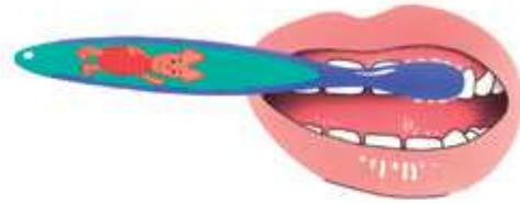
5. Dan weer de buitenkant