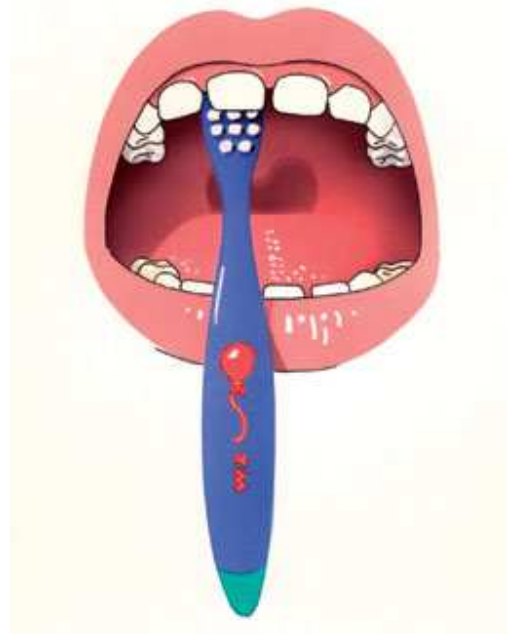
4. Poets vervolgens de boventanden en -kiezen. Poets eerst de binnenkant.