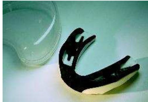
Gebitsbeschermer, te koop in sportwinkels

Gebitsletsel kunt u soms voorkomen. Tijdens het sporten kunt u bijvoorbeeld een gebitsbeschermer dragen. Die biedt geen garantie, maar kan de eventuele schade bij een ongeluk beperken. Er bestaan verschillende soorten beschermers. Kant-en-klare zijn te koop in sportwinkels. Deze passen vaak niet goed en beschermen daarom onvoldoende. Het beste werkt de gebitsbeschermer die precies op maat is gemaakt door uw tandarts.