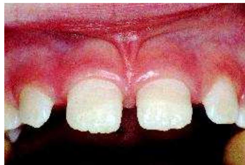
... en hersteld