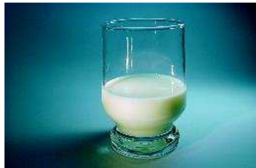
Bewaar de tand in melk