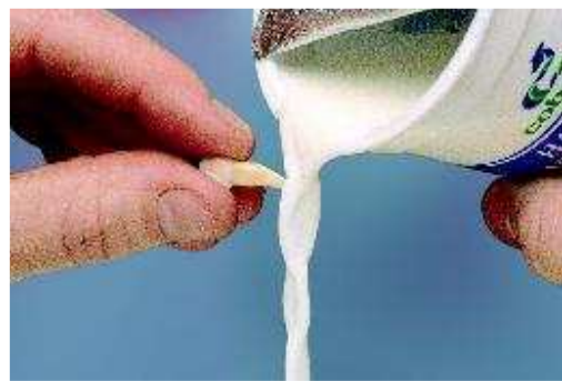
Spoel de tand af met melk