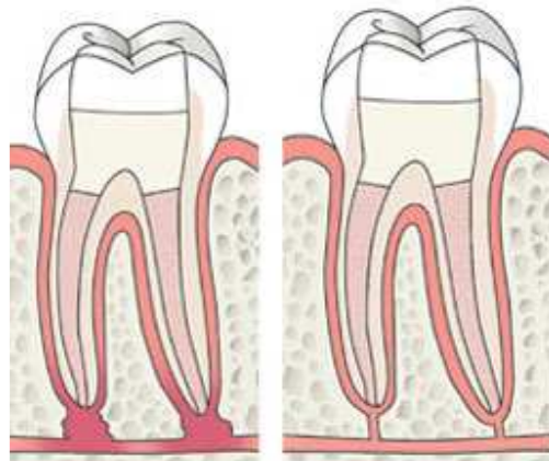
3 Wortelkanalen zijn afgesloten met vulmateriaal en de kies is voorzien van een vulling 4 Geruime tijd later is de ontsteking verdwenen